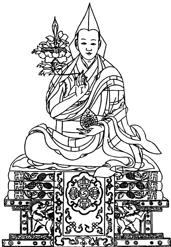
Su santidad el XIV Dalái Lama