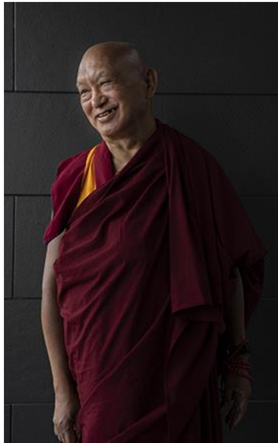
Lama Zopa Rinpoché, Boudhanath, Nepal, septiembre de 2021.