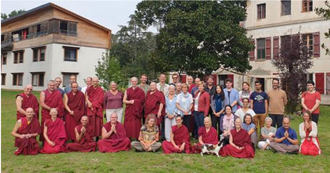
Foto de grupo del reciente Seminario de Servicio de la Fundación en el Monasterio de Nalanda.