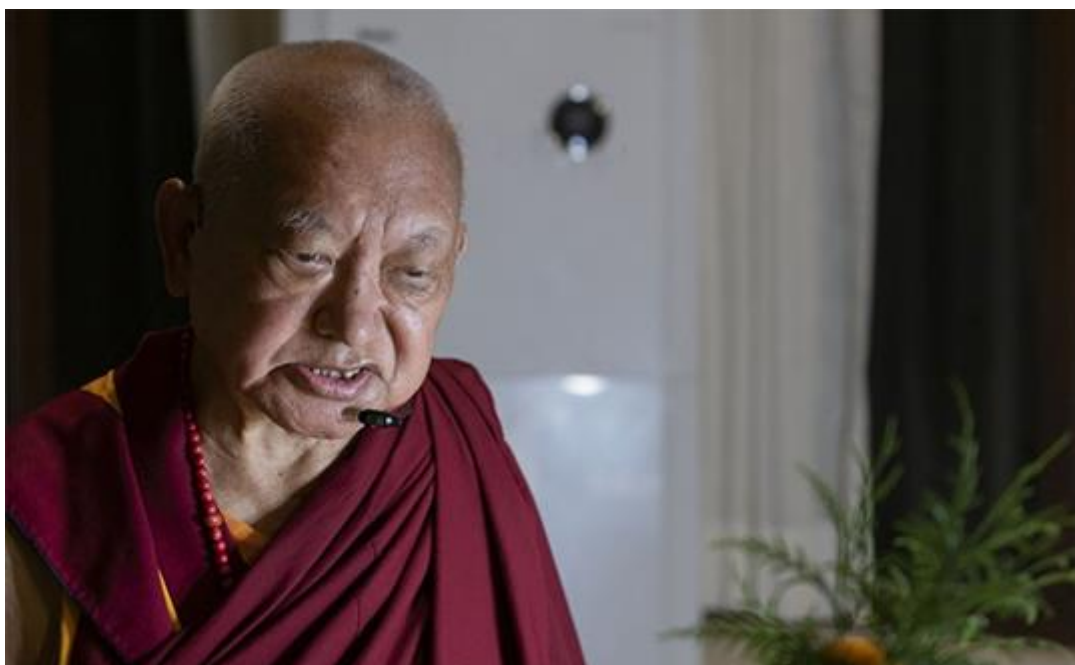
Rimpoché realizando una video-enseñanza en Maratika, Nepal, septiembre de 2021.

Continúan las Enseñanzas sobre la Transformación del Pensamiento