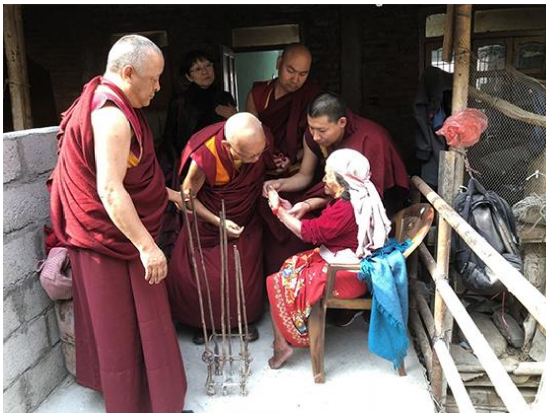
Lama Zopa Rimpoché bendiciendo a una anciana enferma en Maratika, Nepal.

El Fondo de Servicios Sociales de la FPMT ofrece subvenciones a proyectos benéficos principalmente en India, Nepal y Mongolia, que tienen como objetivo servir a niños, ancianos, enfermos y necesitados. Distribuimos fondos para escuelas, hospicios, clínicas de salud, comedores populares y hogares de ancianos. Además, debido a los cierres en 2021, también hemos ofrecido asistencia alimentaria y económica a miles de familias necesitadas. Lee nuestro post más reciente sobre las subvenciones que ofrecimos a Patient Care Trust en India; Clínica del Buda Shakyamuni, en India; Lámpara del Camino, en Mongolia; MATRI Charitable Trust, en India; Kopan Helping Hands, en Nepal; El Comité Central de Socorro Tibetano; y Tsum Community Center, en Nepal.