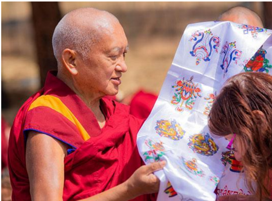
Lama Zopa Rimpoché en el Festival del Buda de Amitabha, Buddha Amitabha Pure Land, Estado de Washington, EE. UU., Agosto de 2019.

Cambia tu visión de los demás para que ellos también puedan cambiar