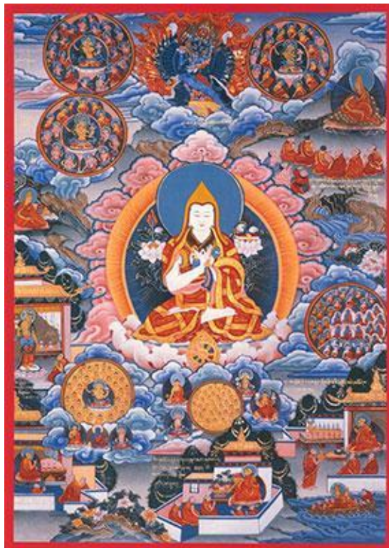
Thangka de Lama Tsongkhapa.

Este año, el Día de Lama Tsongkhapa, que se celebra el 21 de diciembre, constituye el 600 aniversario del parinirvana de Lama Tsongkhapa. Para celebrar el aniversario, la Fundación Internacional Geluk proclamó que 2019 es el Año Internacional de Tsongkhapa.