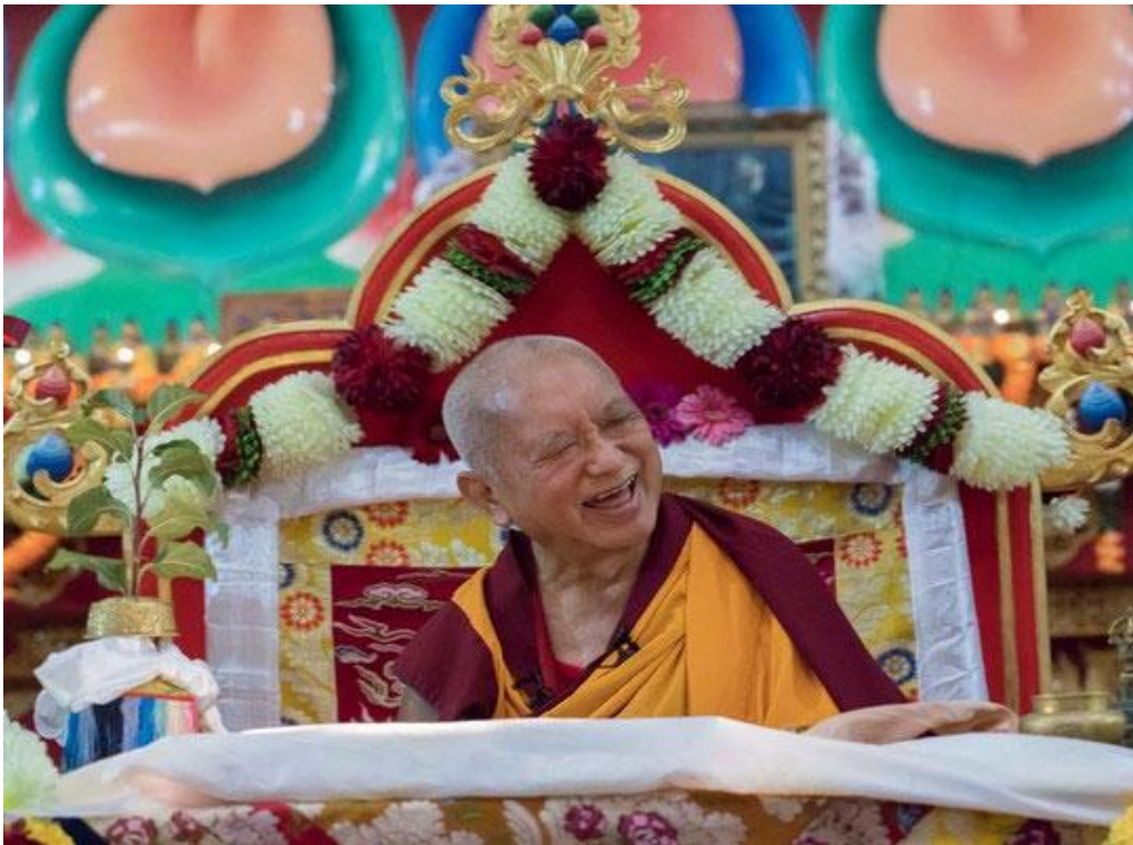
Rimpoché impartiendo enseñanzas y ofreciendo la gran iniciación de Chenrezig, Elista, Kalmykia, Rusia, 5 de octubre de 2019.