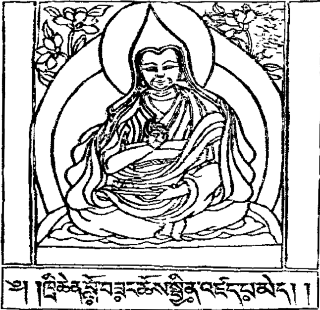
Trichen Losang Jinpa