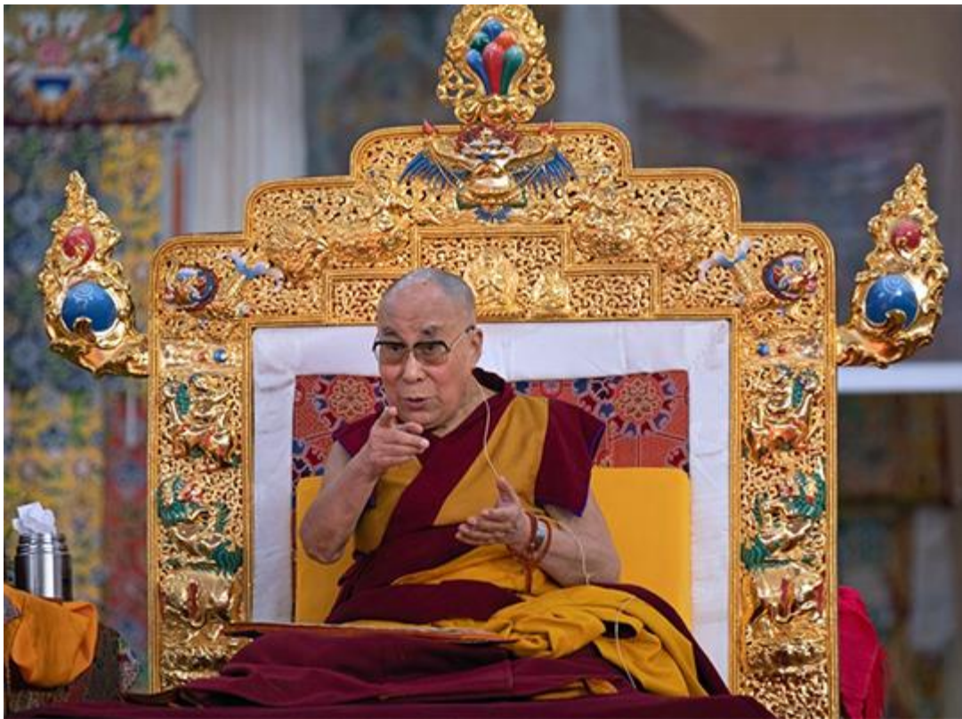
Su Santidad el Dalái Lama impartiendo una enseñanza, Bodhgaya, India, enero de 2017.