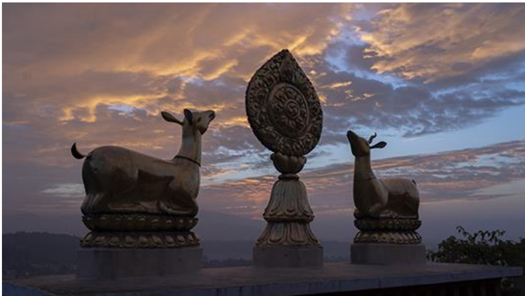
Temprano en la mañana en el monasterio de Kopan, Nepal, diciembre de 2020.

Estamos muy contentos de compartir que el Fondo de la FPMT Dar Donde Más Se Necesita recibió más de $26,000 en contribuciones durante nuestra campaña anual de recaudación de fondos de fin de año, superando nuestra meta de $25,000. Nos regocijamos por esta amable generosidad y las futuras actividades de Dharma a los que se destinen. Muchas gracias a todos los que han contribuido.