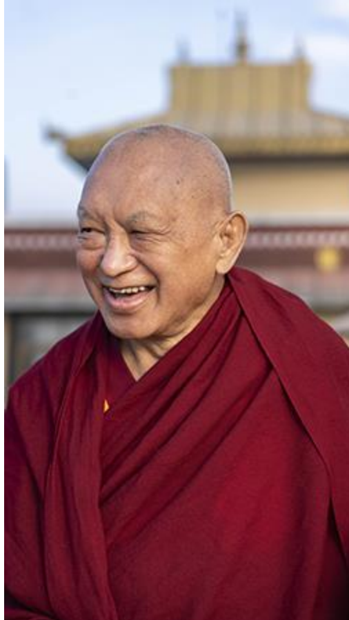
Lama Zopa Rinpoché, Monasterio de Kopan, Nepal, diciembre de 2020.