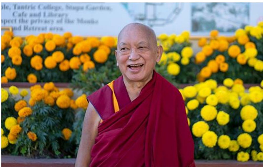
Lama Zopa Rimpoché en el monasterio de Kopan, Nepal, noviembre de 2020.

En las asombrosas enseñanzas continuas de Transformación del Pensamiento en línea de Lama Zopa Rimpoché, Rimpoché aconseja: