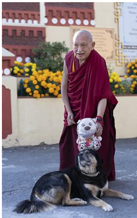
Zopa Rimpoché con un perro de Kopan, Jolie, y otro pequeño amigo, Monasterio Kopan, Nepal, noviembre de 2020.

Suscríbete a nuestro blog de noticias de la FPMT para recibir noticias periódicas.