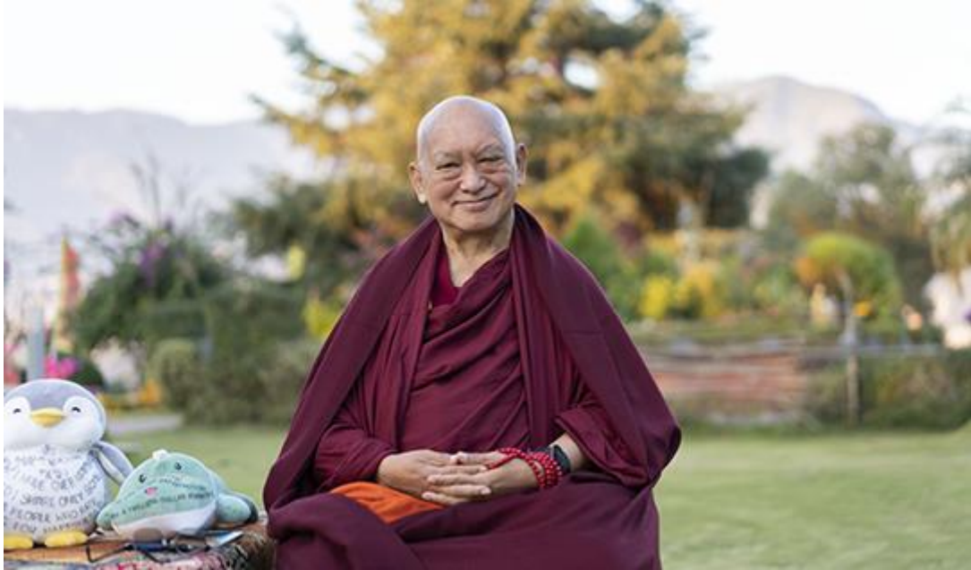
Lama Zopa Rimpoché, Monasterio de Kopan, Nepal, noviembre de 2020.

“Al cambiar tu motivación y trabajar para los demás, cualquier cosa que hagas se vuelve muy importante. Estudiar el Dharma, reflexionar, meditar, incluso comer, dormir, se convierten en un servicio muy importante cuando lo haces por los demás. Entonces tu vida es muy feliz. No hay arrepentimientos. Cuando mueras, estás muy feliz y satisfecho. De una vida a otra, tienes más realizaciones y eres de mayor beneficio para los seres sintientes. De esta forma, tu felicidad aumenta vida a vida y vas hacia la iluminación”.