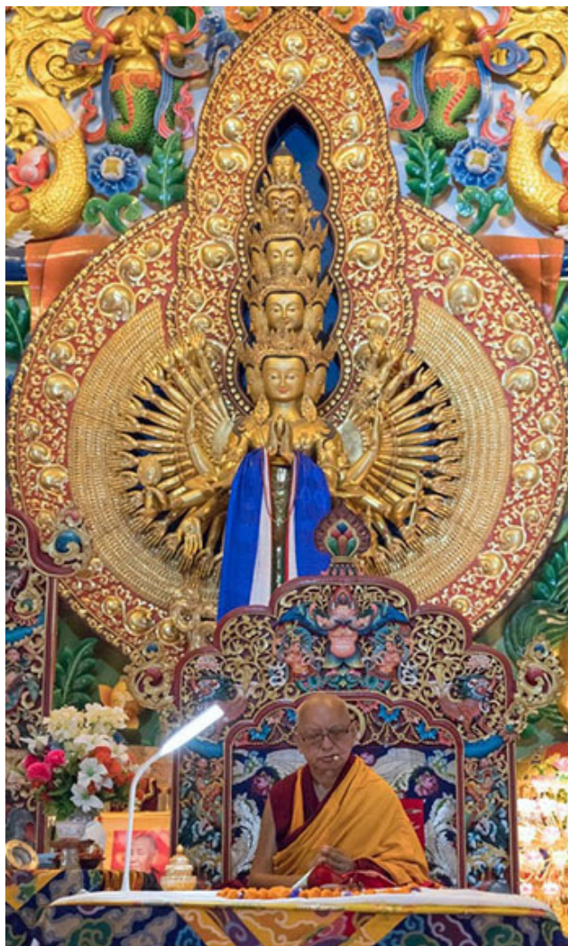
Lama Zopa Rinpoché dando enseñanzas y dando iniciaciones, Monasterio de Kopan, Nepal, Abril 2019.