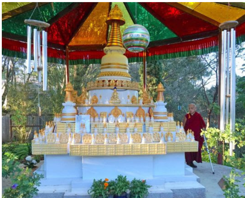
Lama Zopa Rimpoché circumbalando estupas y tsa-tsas en Kachoe Dechen Ling, Aptos, California, Estados Unidos, noviembre 2016.

Lama Zopa Rimpoché aconsejó a un estudiante que dijo que tenía una nueva estupa en su casa: “No tienes que poner esa estupa en tu altar. La gente no mira tu altar. Aquí, lo importante es que la estupa se vea. Cada vez que la ves ahí, es genial, es una purificación enorme que te acerca a la iluminación; y esto ocurre tan sólo por mirar la estupa. Por esta razón, es mejor ponerla en la cocina, en el salón o sobre la mesa. Si tienes muchas estupas, entonces puedes ponerlas sobre una mesa para que puedas moverte alrededor de estos objetos sagrados que están sobre la mesa. Eso hace que circumbalarlos sea muy fácil.” Léelo completamente aquí