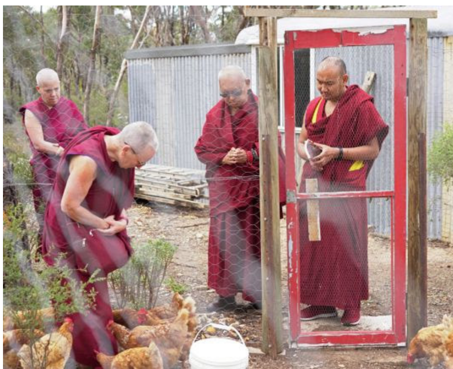
Lama Zopa Rimpoché bendiciendo gallinas en el monasterio Thubten Shedrup Ling, Bendigo, Australia, abril 2018.

A Lama Zopa Rimpoché le preguntaron “¿cuál es la mejor forma de desarrollar bodichita?” Puedes leer la respuesta y ver el video clip: “Mucha gente piensa que tiene que haber otra forma de desarrollar bodichita. Tiene que haber otra forma que no sea el lamrim. Tiene que haber algo especial. ¡No lamrim, no lamrim! Algo fantástico, alguna otra forma. Yo digo “renuncia.” Mi respuesta es “renuncia.” A medida que ves tu sufrimiento en el samsara con más fuerza, entonces piensas en los demás y tienes una compasión más fuerte. Sientes el sufrimiento de otros en el samsara. Entonces desarrollas amor compasivo por otros. Quieres que los otros sean felices, y entonces tienes una compasión más fuerte para que otros se liberen del samsara.” Léelo completamente aquí.