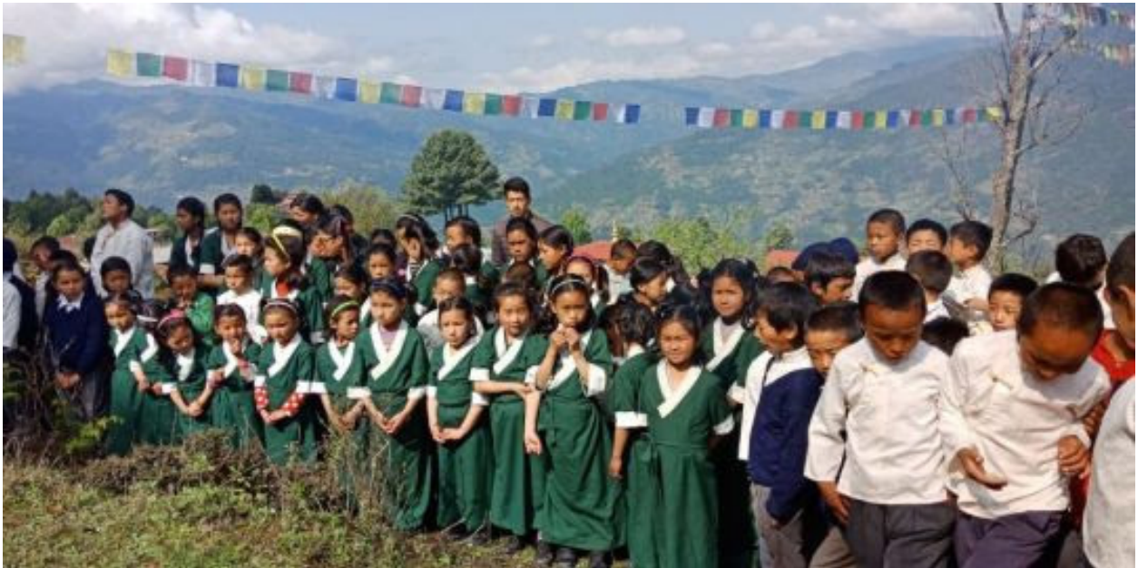
Estudiantes de la escuela de educación secundaria Sagarmatha

Desde 2015, el fondo de los servicios sociales ha estado ofreciendo apoyo a la escuela de educación secundaria Sagarmatha en Chailsa, Nepal. La escuela se encuentra en lo que fue un campo de refugiados tibetano. Actualmente sirve a 170 estudiantes, incluyendo 79 estudiantes laicos que viven internos en la escuela y 25 monjes jóvenes que viven en el monasterio Thubten Shedrup Ling, que tiene terreno común con el colegio. Once profesores y un empleado adicional apoyan a estos estudiantes. Invertir en educación a través de las escuelas es una forma de ayudar a romper el círculo de pobreza en áreas desfavorecidas. Desde 2012 han sido ofrecidas becas para siete escuelas que proveen educación a unos 500 niños.